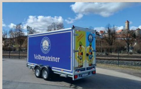
Neuanschaffungen für den Feste- und Veranstaltungsbereich. | Seite 5