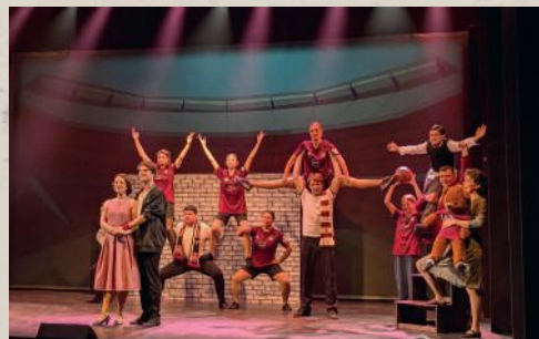
Große Bühne für einen großen Fußballer. Das Musical „Unser Maxl“ in Nürnberg. | Seite 5